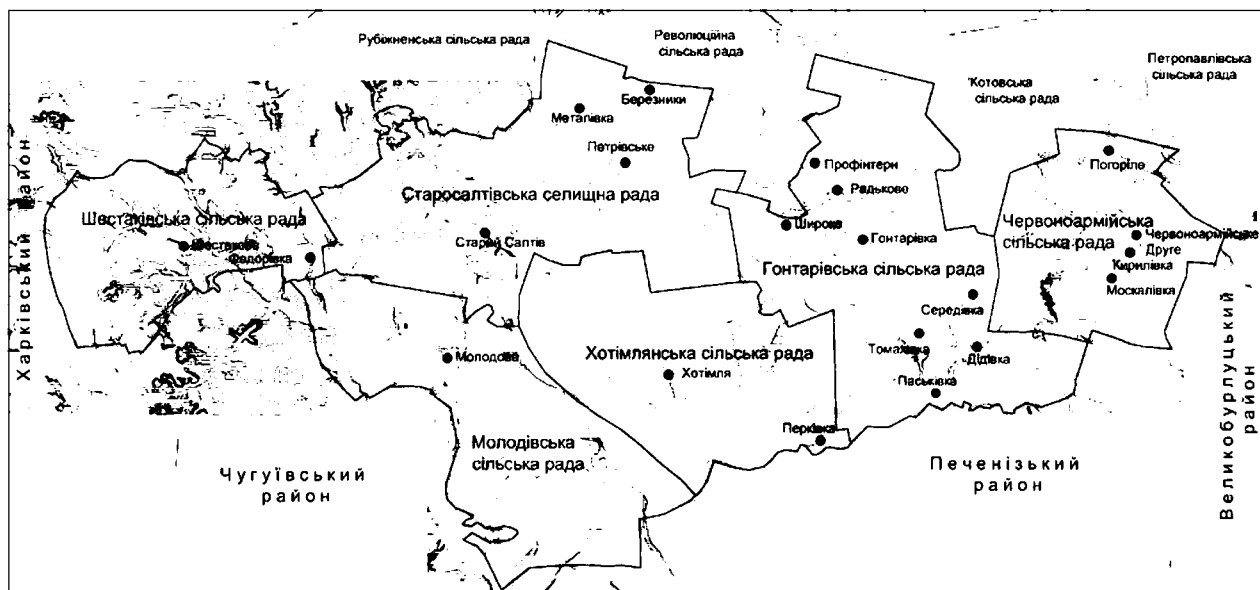
Рис. 1.1 – Карта території Старосалтівської селищної ради