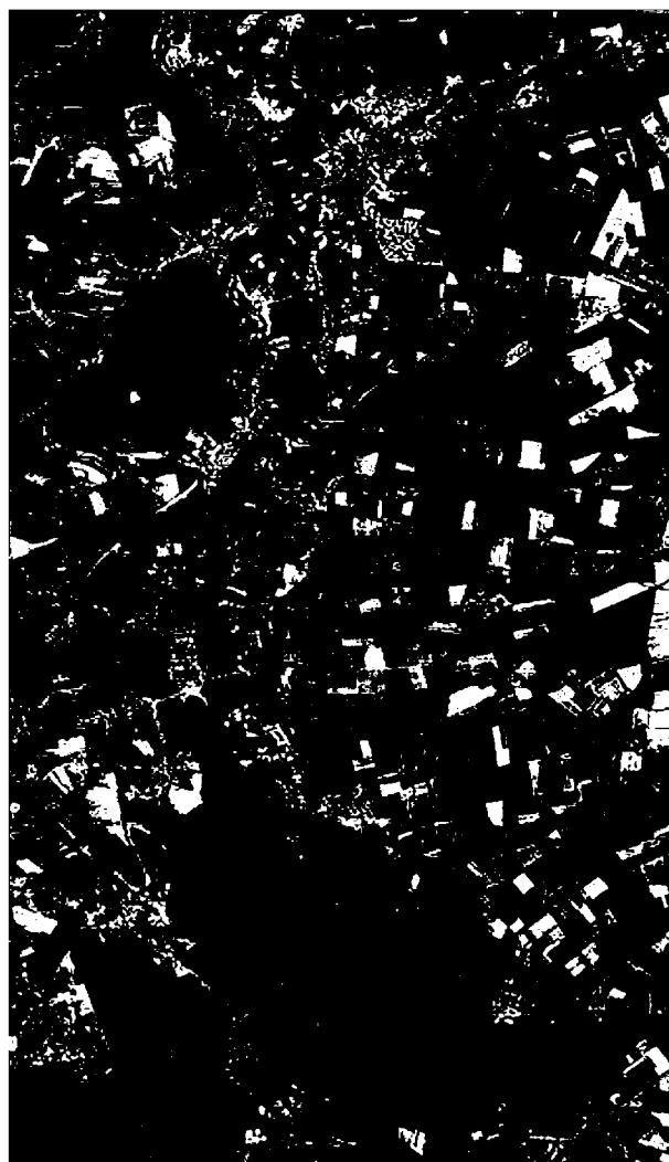
Рис. 1.1 – Печенізьке водосховище